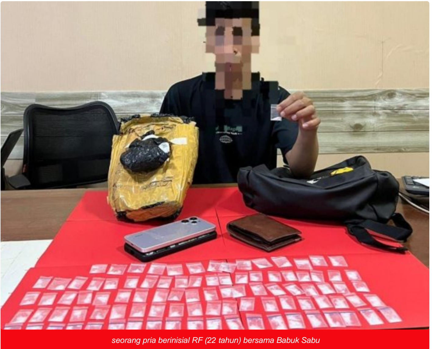
seorang pria berinisial RF (22 tahun) bersama Babuk Sabu

MOROWALI, Sulawesi Tengah- Personel Satuan Reserse Narkoba (Satresnarkoba) Polres Morowali kembali menunjukkan komitmennya dalam