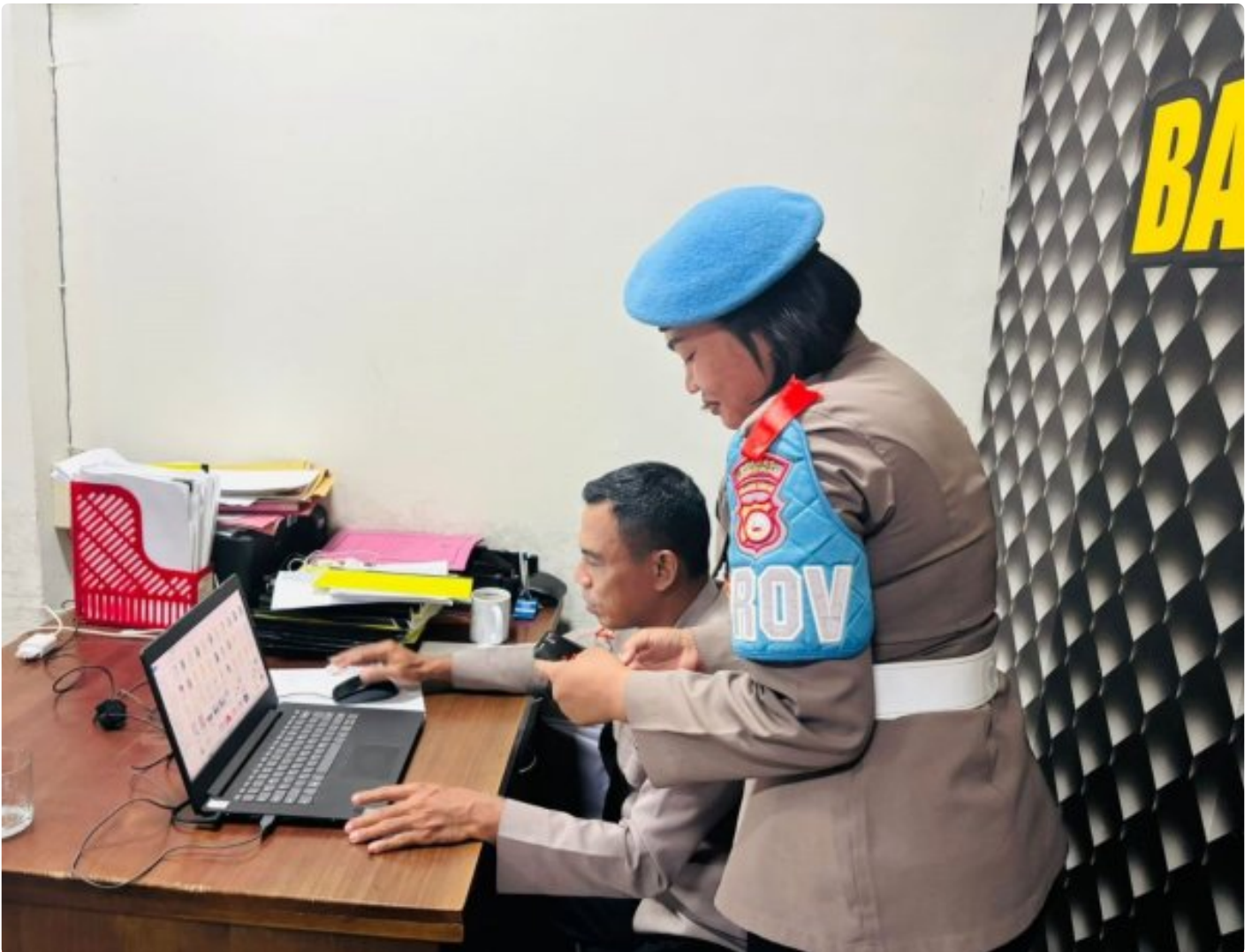
Tampak Propam Polres Morowali periksa ponsel personil